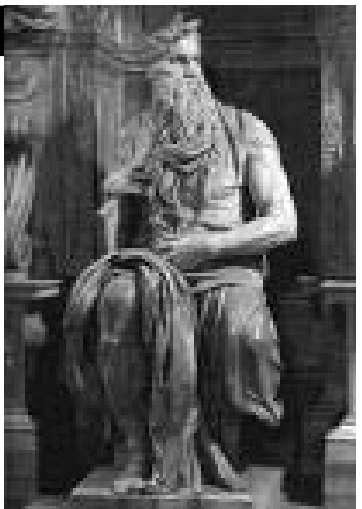
മൈക്കിൾ ആഞ്ചലോയുടെ ഭാവനയിൽ മോശ

✘ യിസ്രായേൽ ജനത്തിന്റെ നായകനായിരുന്ന ഈ അത്ഭുതപുരുഷനെക്കുറിച്ച് ദൈവം നൽകിയ സാക്ഷ്യം "മോശെ എന്ന പുരുഷനോ ഭൂതലത്തിലുള്ള സകല മനുഷ്യരിലും അതിസൗമ്യനായിരുന്നു" എന്നത്രേ. നാൽപ്പത് വർഷം മോശെ യിസ്രായേൽ ജനത്തെ നയിച്ചു യോർദ്ദാൻ നദി കടന്നു വാഗ്ദത്ത നാട്ടിൽ പ്രവേശിക്കുവാൻ കല്പനയും പ്രതീക്ഷിച്ചു ജനം മോവാബിൽ കഴിയുകയായിരുന്നു. കനാൻ പ്രവേശിക്കുവാനുള്ള അവകാശം മോശയ്ക്കു നഷ്ടപ്പെട്ടു കഴിഞ്ഞിരുന്നുവെങ്കിലും (സംഖ്യ. 20:12) ദൈവത്തിന്റെ കൽപ്പന അനുസ