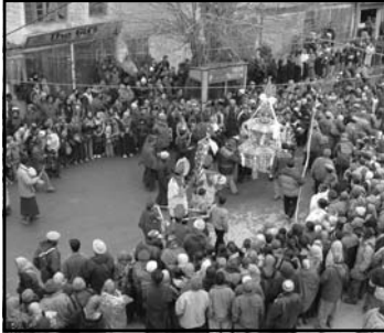
ബുദ്ധമത വിശ്വാസികളുടെ ഉത്സവം