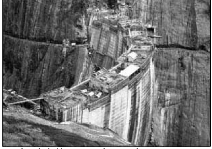
ഇടക്കി ഡാമിന്റെ നിർമ്മാണ ഘട്ടത്തിലെടുത്ത ചിത്രം

പുർവ്വ ചരിത്രം വളരെ സമ്പന്നമായിരുന്നു. എന്നാൽ ഗാട്ട് കരാറിലൂടെ ലോകത്തിന്റെ വിവിധ ഭാഗങ്ങളിൽ നിന്നുള്ള നാണുവീളുകളുടെ ഇറക്കുമതിയോടെ കാർഷിക മേ