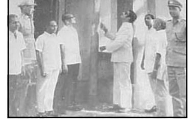
ഇടക്കി ജില്ലയായി പ്രഖ്യാപിച്ചുകൊണ്ടുള്ള ചടങ്ങ്

വിവരണങ്ങൾ കൊണ്ട് വിവരിച്ചു തീരാത്ത ഇടക്കി "ഇടക്കി" എന്ന വാക്കിൽ നിന്ന് രൂപം പ്രാപിച്ച പേരാണ്. കേരളത്തിലെ വൻ നദികളിലൊന്നായ പെരിയാർ കുലംകുത്തി ഒഴുകിയിരുന്നത്. "കുറവൻ, കുറത്തി" മലകളുടെ ഇടക്കിയുടെയാണ്. ഇതാണ് 'ഇടക്കി' എന്ന പേർ വരുവാൻ കാരണമെന്ന് പറയപ്പെടുന്നു. പിന്നീട് ഈ 'കുറവൻ, കുറത്തി' മലകൾ യോജിപ്പിച്ചാണ്. വിസ്മയ കാഴ്ചയായ ഇടക്കി ഡാം നിർമ്മിച്ചത്. മുല്ലപെരിയാർ, കുളമാവ്, ചെറുതോണി, ലോവർ പെരിയാർ, ഇടമലയാർ തുടങ്ങി വലിയ ഡാമുകളും അനേക അനുബന്ധ ഡാമുകളും (ചെക്ക് ഡാം) ഉള്ള ഇടക്കിയെ ഡാമുകളുടെ "അമ്മ" എന്നും വിശേഷിപ്പിക്കാം.