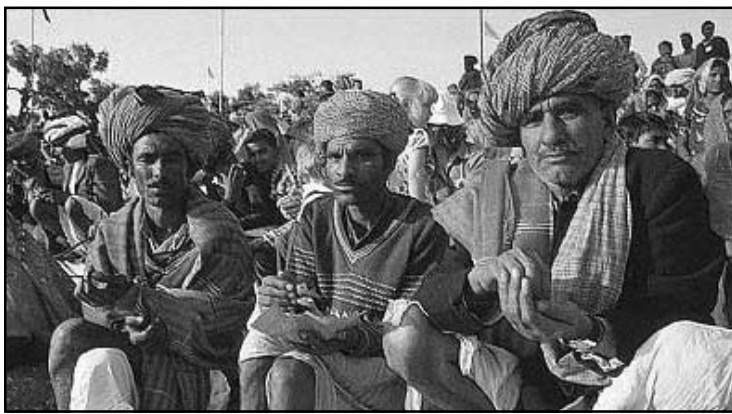
പരമ്പരാഗത വസ്ത്രധാരികളായ മാർവാടികൾ

വലിയൊരു വിഭാഗവും ഹൈന്ദവ മതാനുസാരികളാണെങ്കിലും ദേശത്തിലെ വീര നായകന്മാരെയും, പ്രാദേശിക ദേവന്മാരെയും ആരാധിക്കുന്നവരും കുറവല്ല. ജൈനരും മുസ്ലിങ്ങളും ഇവരുടെ കൂട്ടത്തിലുണ്ട്. ഈ മേഖലയിലെ